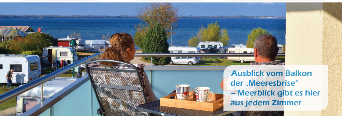
Ausblick vom Balkon der „Meeresbrise“ – Meerblick gibt es hier aus jedem Zimmer

Pro Aufenthalt ist einmalig der angegebene Preis für die Endreinigung zu zahlen. Ferienwohnung 1-10: Ihre Lieblingsbettwäsche & Handtücher bitte mitbringen! Die Matratzenbreite beträgt 90 cm, sofern nicht anders angegeben. Im Einzelfall können wir gegen Gebühr Bettwäsche für 8,-€ pro Person auch aushelfen. Preis für ein zusätzliches Baby-Reisebett 8,-€ pro Woche, Hochstuhl 5,-€ pro Woche. Ferienwohnungen „Meeresbrise“ und „Morgensonne“: Handtücher, Geschirrtücher und Bettwäsche sind inklusive. Haustiere sowie Rauchen sind in den Ferienwohnungen leider nicht erlaubt. In „Meeresbrise“ und „Morgensonne“ ist zudem das Grillen auf dem Balkon nicht erlaubt. Zum Grillen können Sie gern die Lagerfeuerplätze auf dem Campingplatz benutzen.